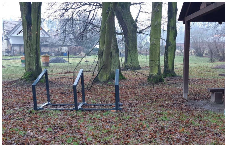
■ ul. U Důlníáku x ul. Na Pasekách, Bartovice

v aplikaci. Fyzické stanice jsou často městské nebo komerční stojany, popřípadě vymezená a označená místa na pozemní komunikaci, kde stačí kolo postavit do stojánku a zamknout. Po ukončení výpůjčky stačí manuální stáhnutí zámku nad zadním kolem a výpůjčka se po zvukovém signálu ukončí. V aplikaci již nemusíte nic volit, je však doporučena kontrola správného