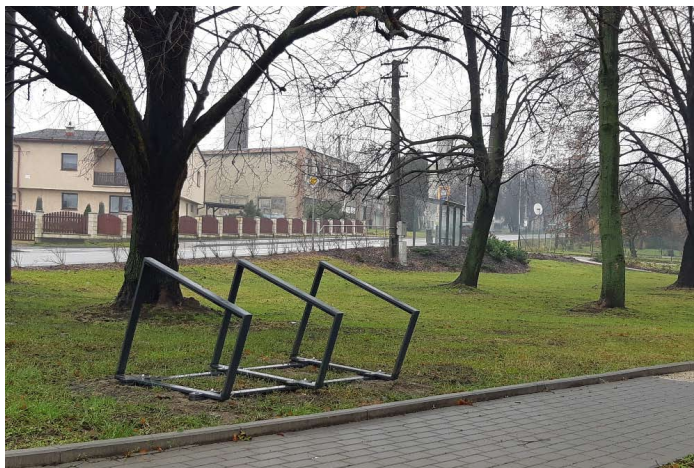
■ ul. Čapkova v parku U Káňů, Radvanice

2021. Bikesharing tak budou moci využívat občané i návštěvníci našeho městského obvodu.